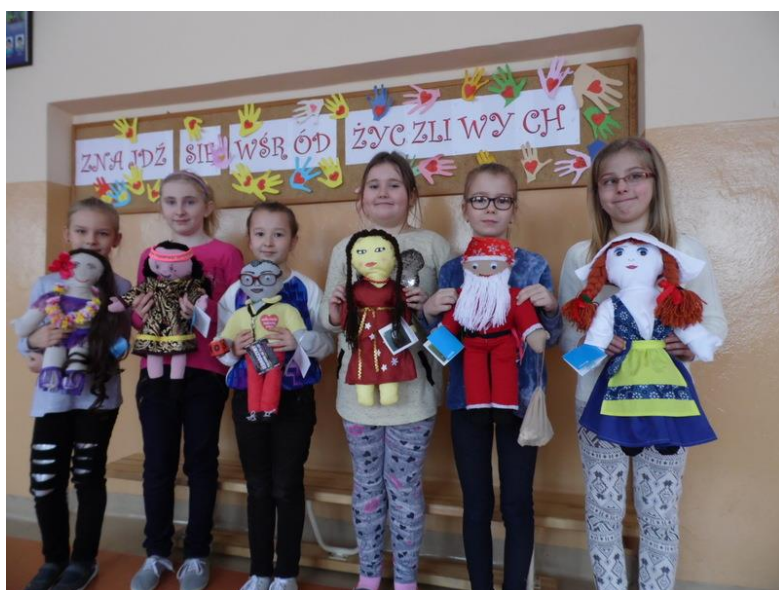
Teści i foto Jolanta Morta

Dzięki wielkiemu zaangażowaniu całej naszej szkolnej społeczności udało się pozyskać 620 złotych na ratowanie życia dzieci w Sierra Leona, Czadzie i Sudanie Południowym. Po zrealizowaniu projektu szkoła otrzyma „Certyfikat Społecznie Zaangażowanej Placówki” w roku szkolnym 2016/2017.