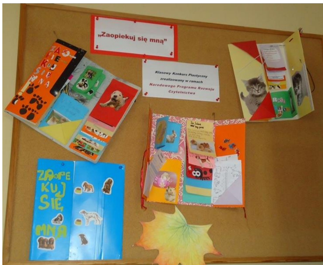
Lapbooki czytelników z klasy 3