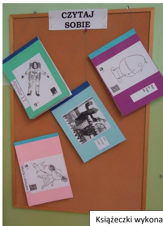
Książeczki wykonane przez uczniów z klasy 1 i 2

W czasie realizacji projektów edukacyjno-czytelniczych uczniowie wykonywali prace plastyczne związane z treścią omawianych książek.