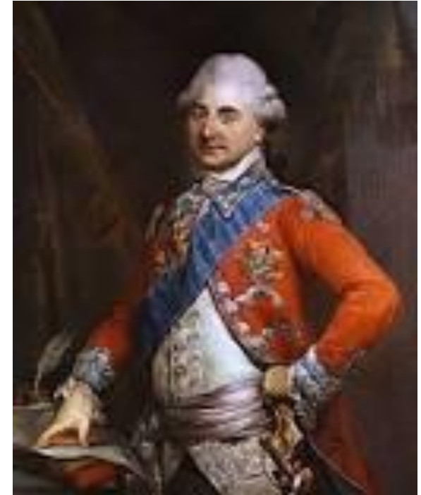
Stanisław August Poniatowski