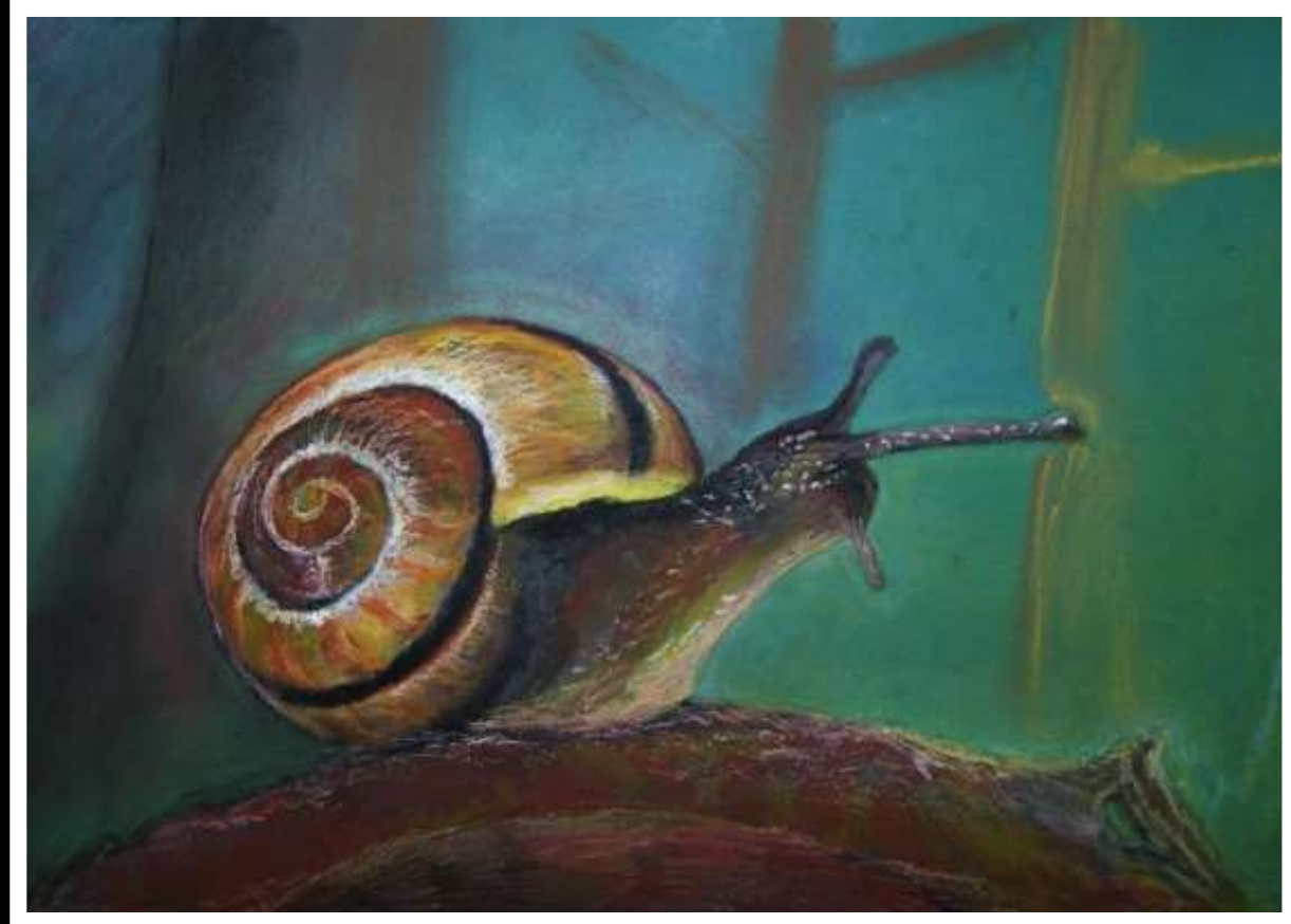
Izabela Pędzich kl. IIIa