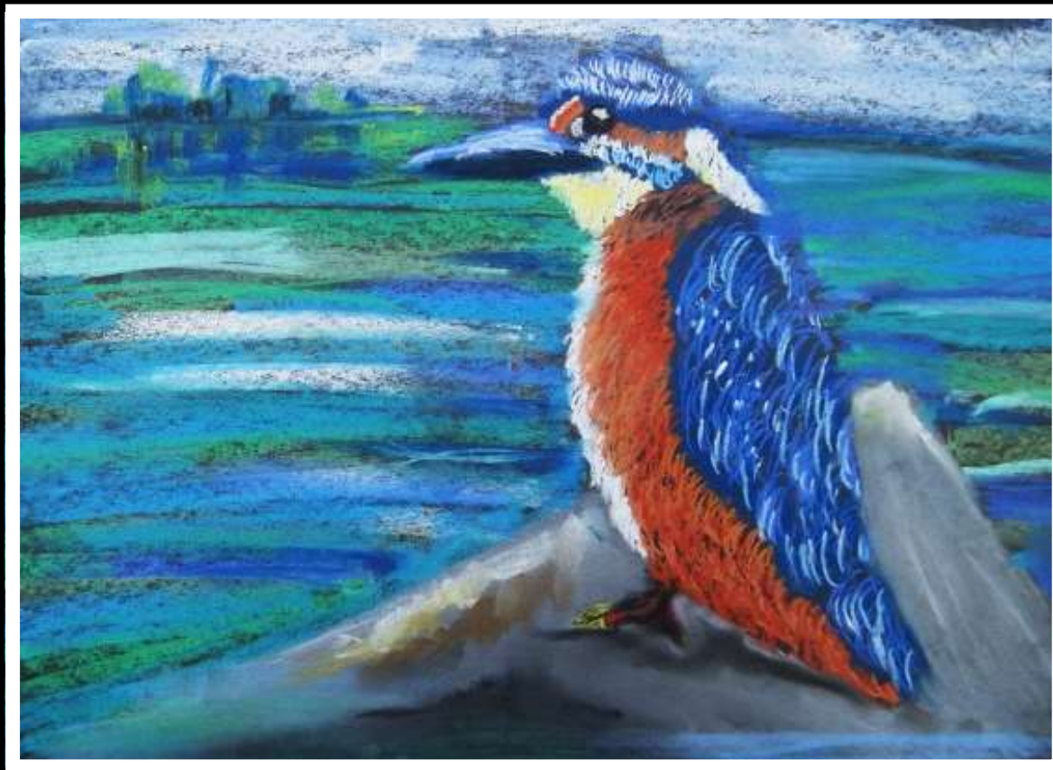
Alan Urraso kl. V