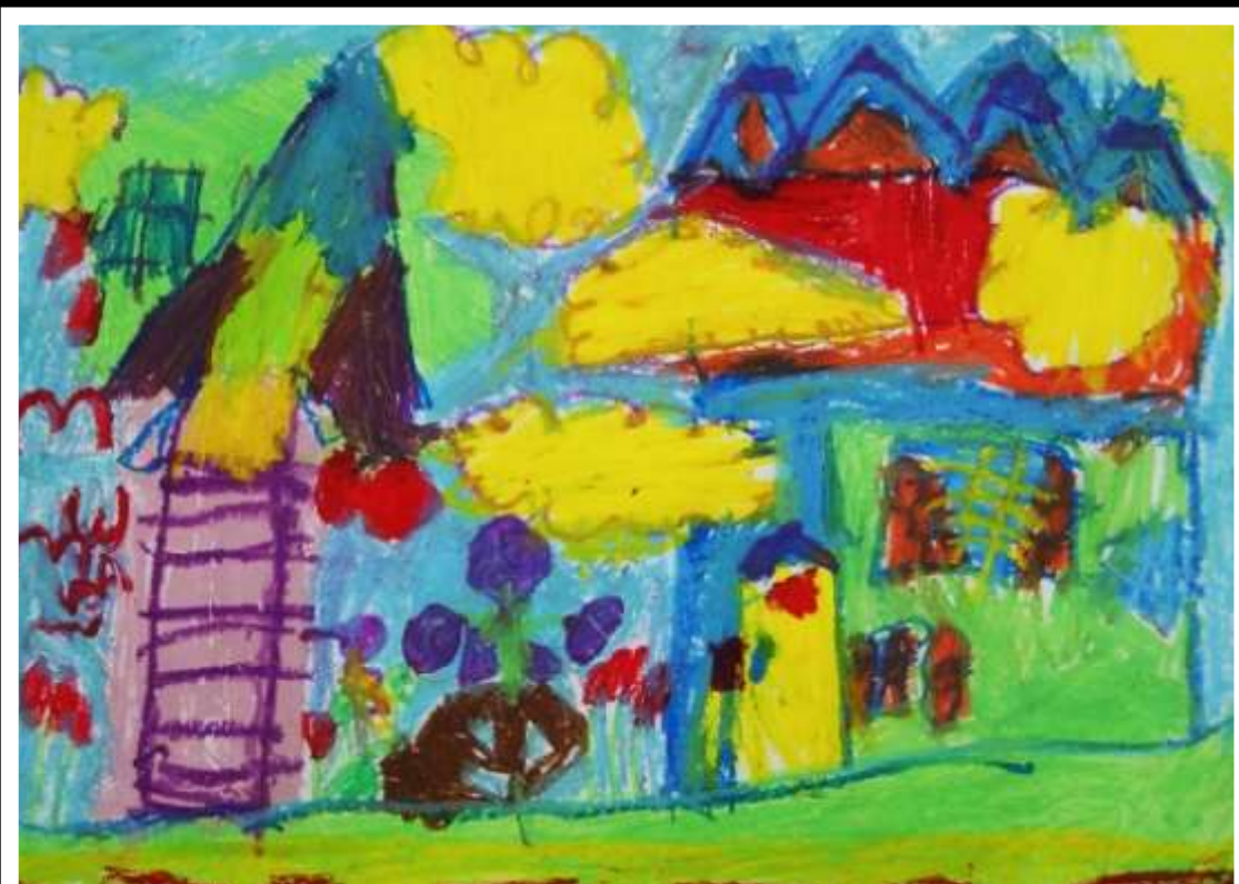
Filip Rybiński oddział przedszkolny 0b