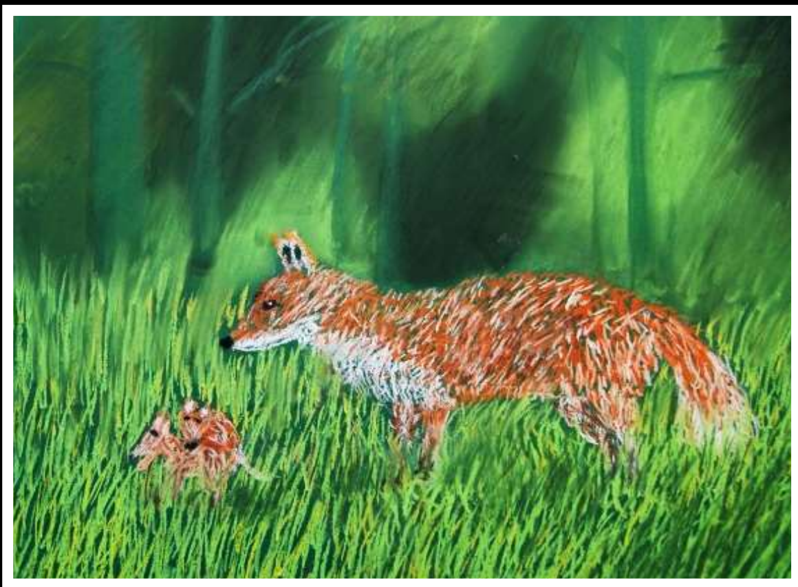
Wiktoria Rogalska kl. VIb