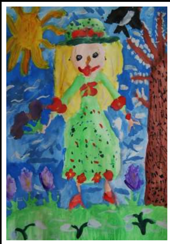
Maja Piątek kl. Ia