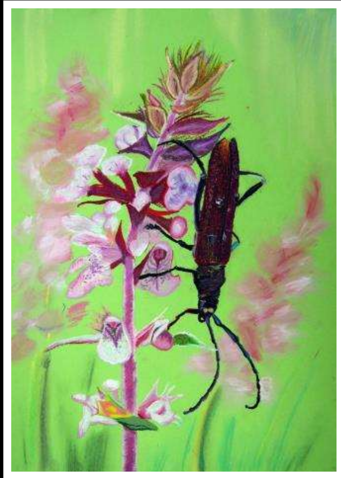
Amelia Bułatowicz kl. VIa