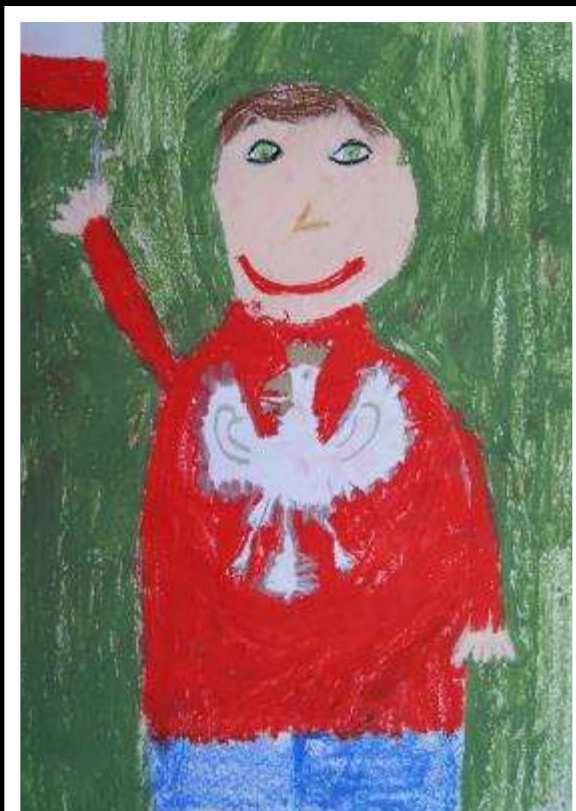
Maja Piątek kl. Ia