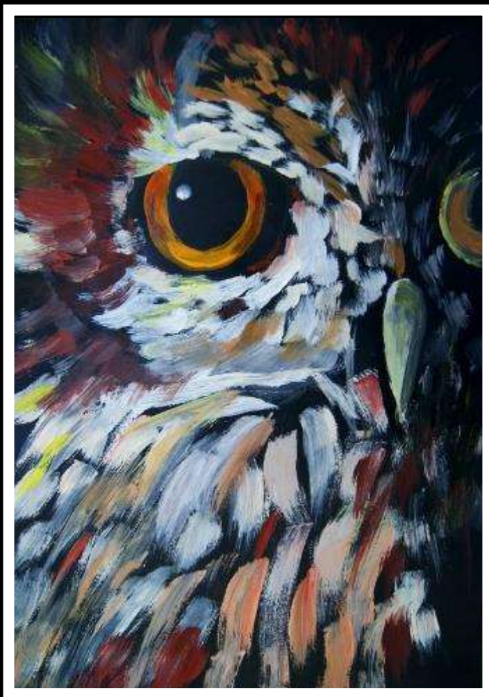
Olga Ludwikowska kl. VII