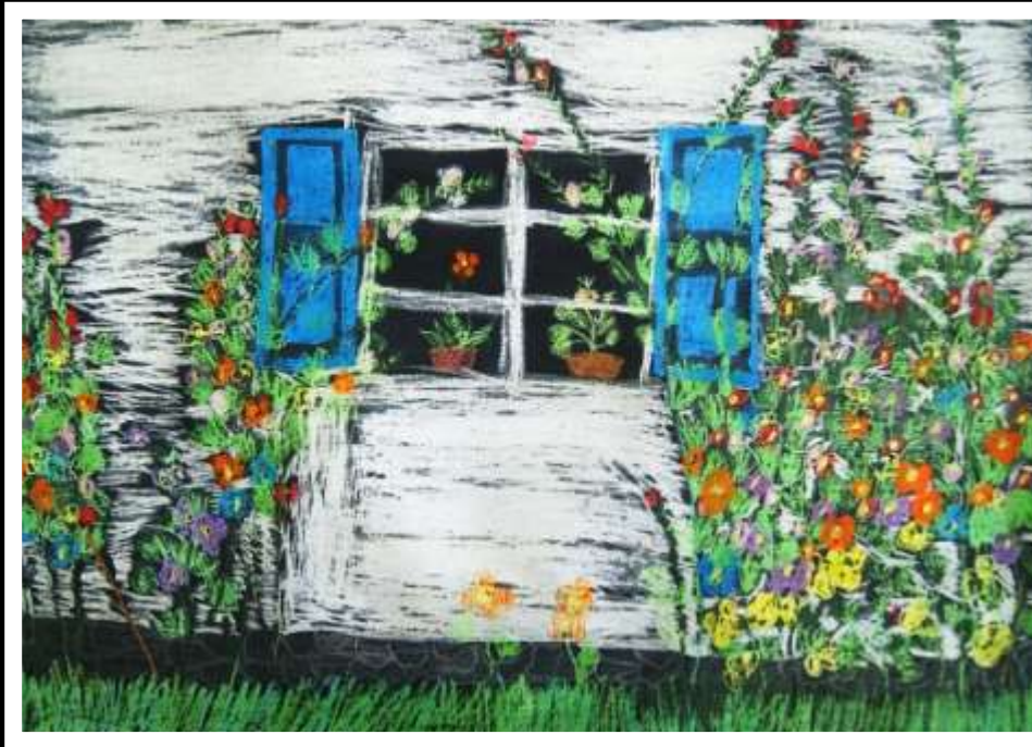
Mateusz Książek kl. VIb