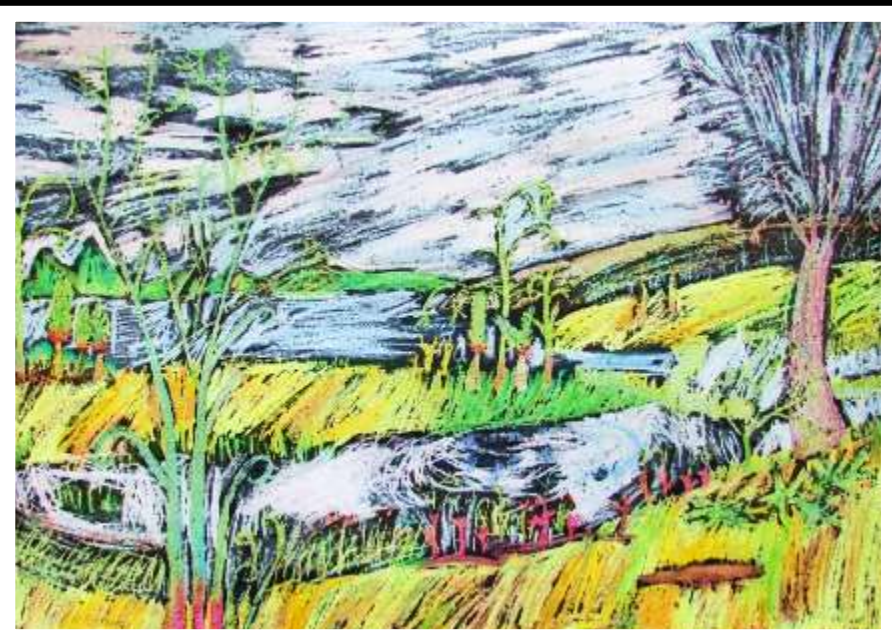
Mikołaj Pietras kl. IVb