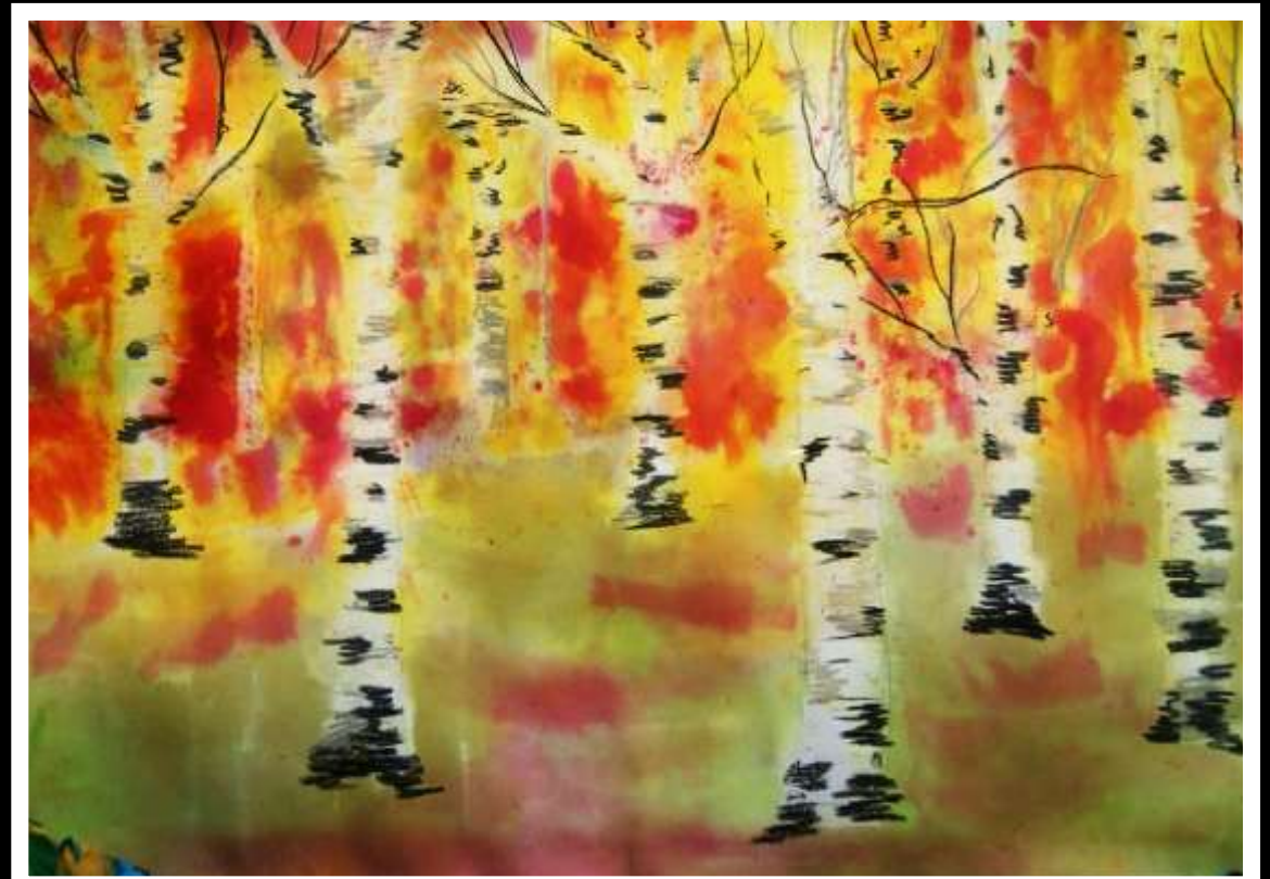
Michał Bloch kl. VIa