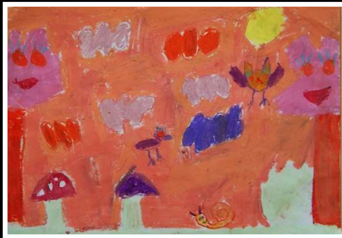
Alicja Otwinowska oddział przedszkolny Ob