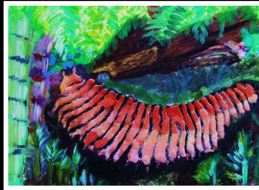
Mateusz Książek kl. V