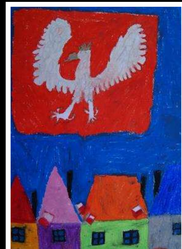
Natalia Ołów kl. Ia