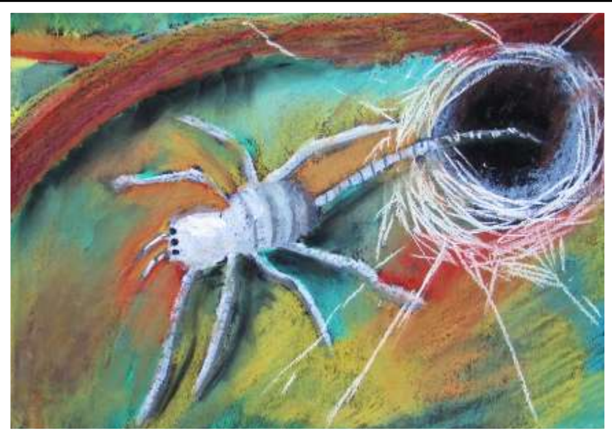
Mikołaj Pietras kl. IVb