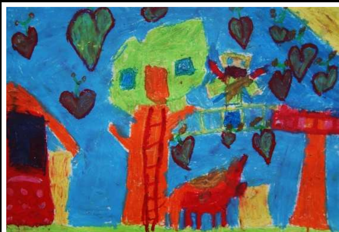
Kacper Rytelwski oddział przedszkolny 0b