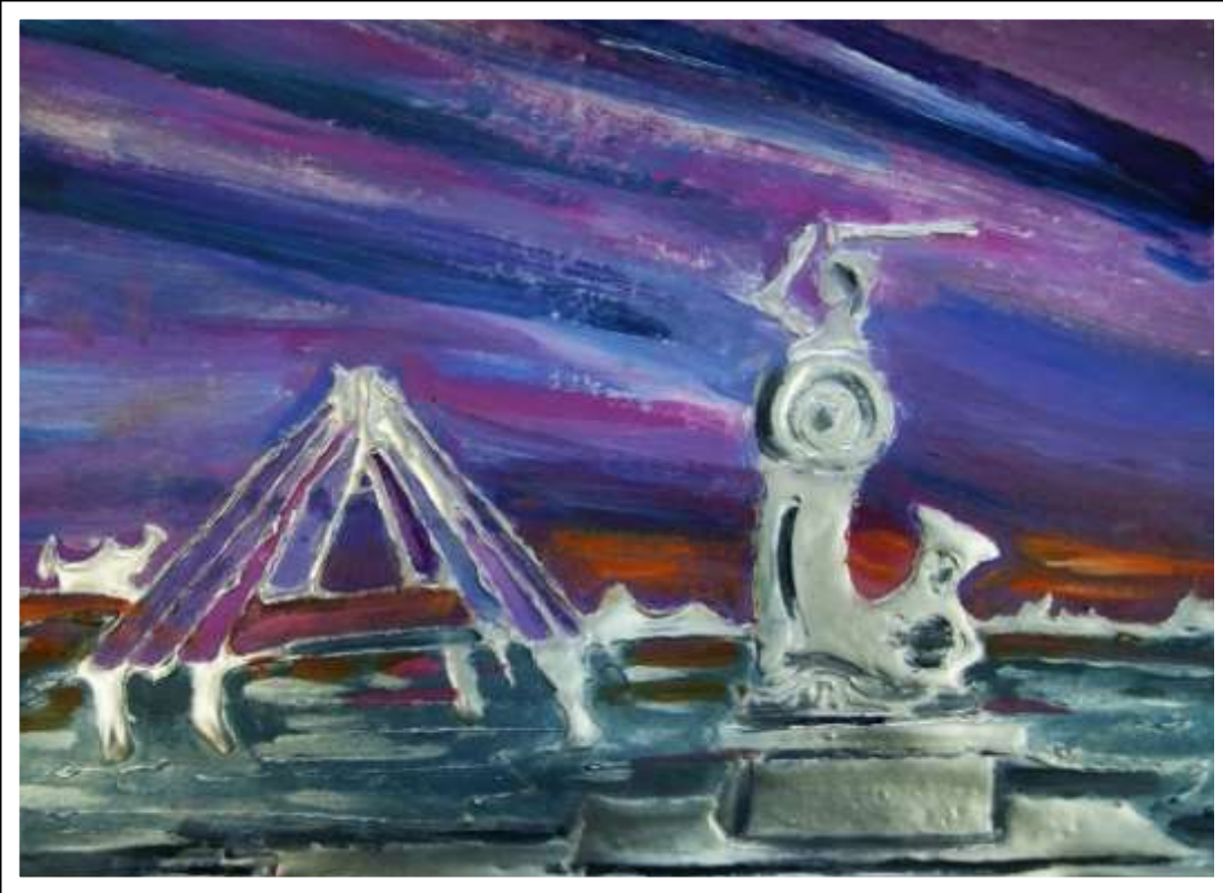
Natalia Książek kl. IIb gimn