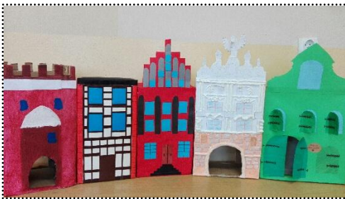
Projekty kamieniczek toruńskich wykonane przez uczniów klas III na zajęciach technicznych (od lewej: Brama Mostowa, Krzywa Wieża, Łuk Cezara, Dom Kopernika, Muzeum Podróżników)