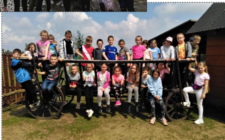
Klasy 2b i 3b na wycieczce w Wiosce Ginących Zawodów w Koronowie