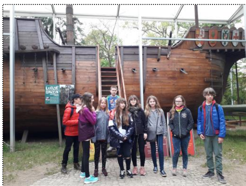
Klasa 6b na wycieczce w Poznaniu przy replce statku Krzysztofa Kolumba w skali 1:1