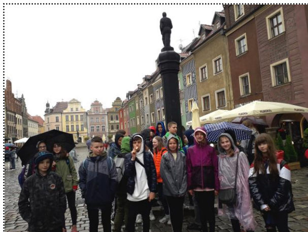
Klasa 6b na wycieczce w Poznaniu