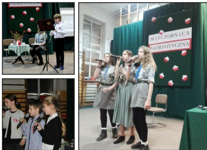
Fot. Uczniowie podczas występów