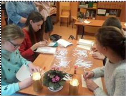
Fot. Podczas wspólnego tworzenia wierszy.