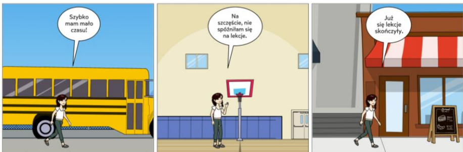
Wiktoria z kl. 3c