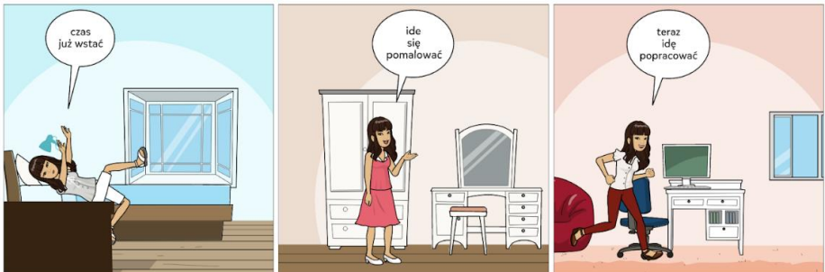
Julia z kl. 2b