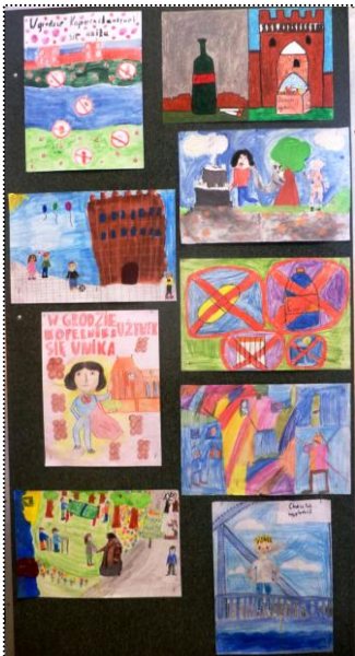
Prace plastyczne uczniów powstałe z okazji Października Miesiąca Wolnego od Uzależnień