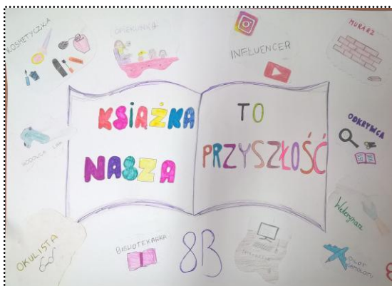
Plakat klasy 8b