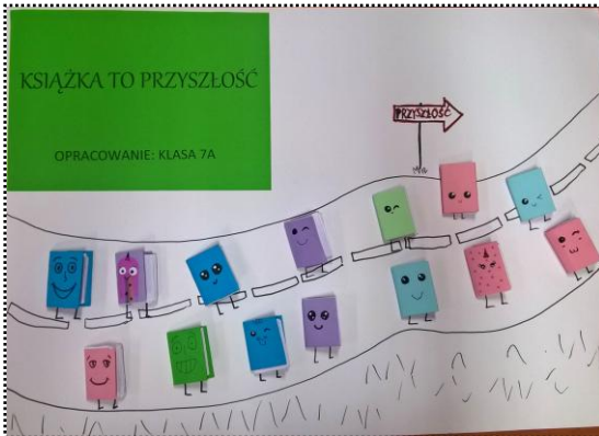
Plakat klasy 7a

Oto plakaty wykonane przez uczniów z okazji święta bibliotek. Wystawa plakatów znajduje się w holu szkoły w budynku Morcinka i Bema.