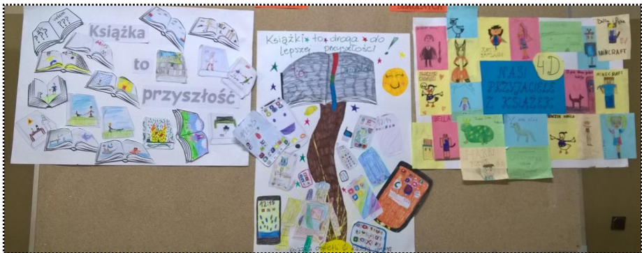
Plakaty klas 4b, c, d