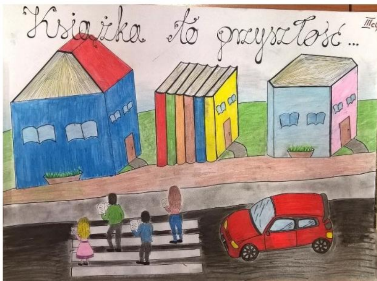
Plakat klasy 3c gimnazjum z okazji święta bibliotek szkolnych

WRZESIEŃ/PAŹDZIERNIK 2018 MAGAZYN MŁODYCH DZIENNIKARZY