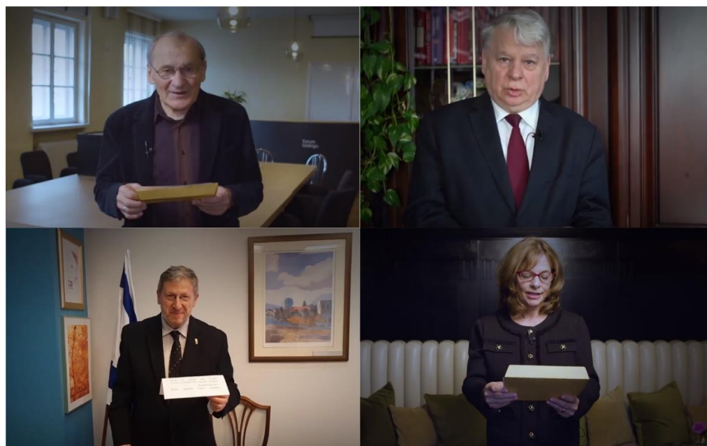
Mówcy podczas Gali Online Szkoły Dialogu 2019.

Forum Dialogu już od 12 lat wspiera uczniów szkół podstawowych i ponadpodstawowych w poszukiwaniu osobistych losów dawnych członków ich społeczności lokalnej. Grupy projektowe uczestniczące w programie Szkoła Dialogu odkrywają często zapomnianą historię i kulturę żydowską w swojej miejscowości, a następnie poprzez różnorodne działania prezentują zdobytą wiedzę innym mieszkańcom. W związku z zagrożeniem epidemiologicznym chorobą COVID-2019 tegoroczne uroczyste podsumowanie kolejnej edycji programu, a zarazem uhonorowanie uczestników i uczestniczek oraz podziękowanie za ich ciężką pracę, odbyło się online 17 kwietnia 2020 roku.