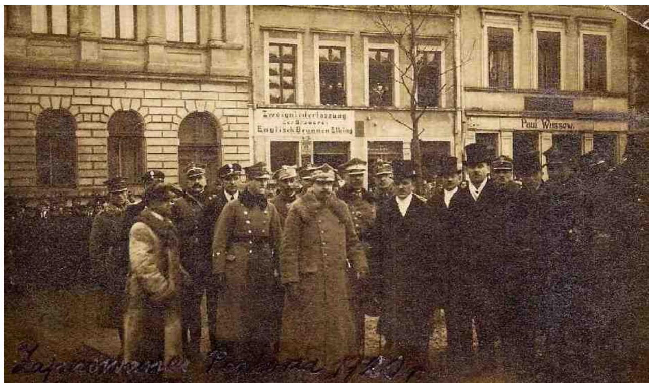
Historyczne zdjęcie sprzed 100 lat

30 stycznia nasze miasto obchodziło 100 rocznicę odzyskania niepodległości. To bardzo ważne wydarzenie - powrót Tczewa do Polski po wielu latach zaboru pruskiego. Na mocy Traktatu Wersalskiego, czyli głównego układu pokojowego kończącego pierwszą wojnę światową, Pomorze wróciło do Macierzy. Symbolicznego przyłączenia ziem dokonywali żołnierze Frontu Pomorskiego pod dowództwem gen. Józefa Hallera.