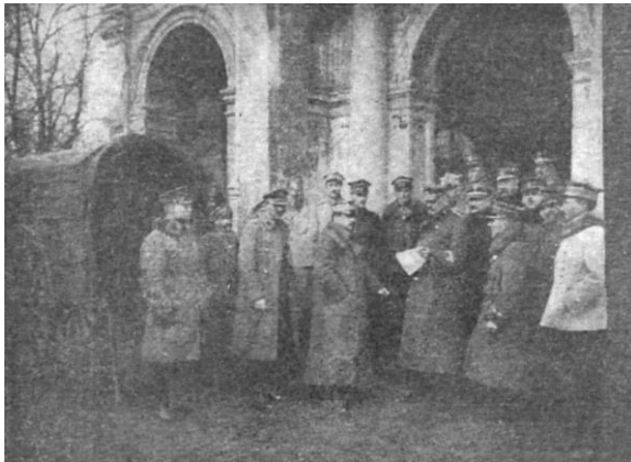
gen. Haller ze sztabem przed wyruszeniem ze Skierniewic

Dowództwo frontu musiało podjąć wiele ważnych decyzji dotyczących m.in. wcielenia oddziałów wojskowych w skład frontu, ustalenia terminów przejmowania poszczególnych ziem na Pomorzu oraz sposobów działania, gdyby Niemcy stawiali opór.