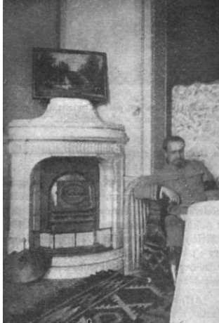
gen. Józef Haller w dawnym pałacu cesarskim w Skierniewicach.