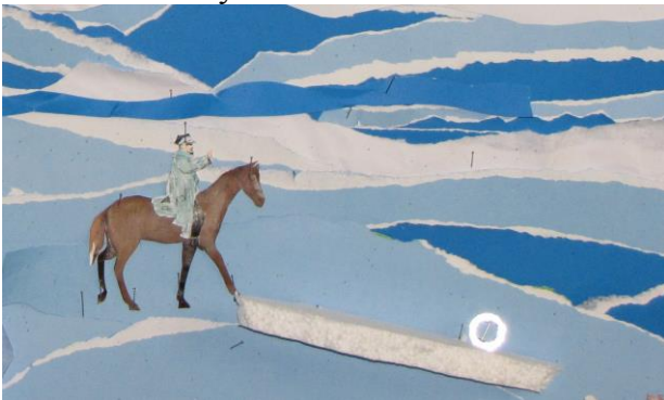
Fragm. gazetki szkolnej (wyk. członkowie koła LMiR)

10 luty 1920 r. to symboliczny dzień powrotu Rzeczypospolitej nad Bałtyk. W Pucku zorganizowano zaślubiny Polski z morzem. Na uroczystość przyjechały najważniejsze osoby w państwie, między innymi: generał Józef Haller – dowódca Frontu Pomorskiego, minister spraw wewnętrznych - Stanisław Wojciechowski, wicepremier - Wincenty Witos, minister spraw zagranicznych - Ignacy Daszyński, wojewoda pomorski - Maciej Rataj, kontradmirał Kazimierz Porębski oraz dyplomaci: szef misji brytyjskiej i attaché wojenny USA. Wśród osób zasłużonych dla Polski i morza byli: Antoni Abraham – kaszubski działacz niepodległościowy, generał Kazimierz Sosnkowski, Henryk Dobrzański – legendarny major „Hubal”, malarz Leon Wyczółkowski.