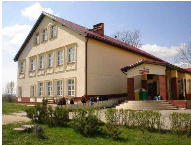
Nowy budynek szkolny.

Dzięki władzom gminnym i społeczności lokalnej powstała ładna i nowoczesna szkoła.