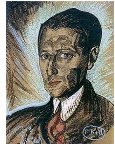
Witkacy: Portret Tuwima 1929: