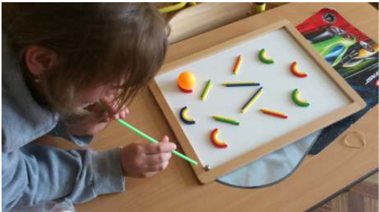
By dobrze czytać i poprawnie wypowiadać się należy ćwiczyć swój aparat artykulacyjny a także oddechowy.